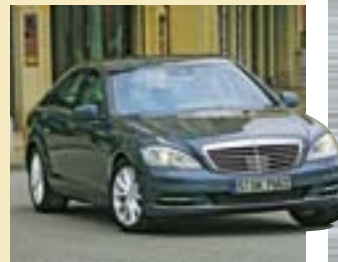
Mercedes S-Klasse: Der große Stuttgarter gilt seit langem als der Fixstern im Segment der Luxus-Fahrzeuge

Gemeint ist damit alles, was das Automodell direkt betrifft: sein Design, sein Image, seine Käuferschicht, sein Abschneiden in Tests der Fachpresse sowie in Käuferbefragungen.